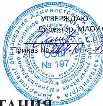
ГРАФИК ПИТАНИЯ ОБУЧАЮЩИХСЯ